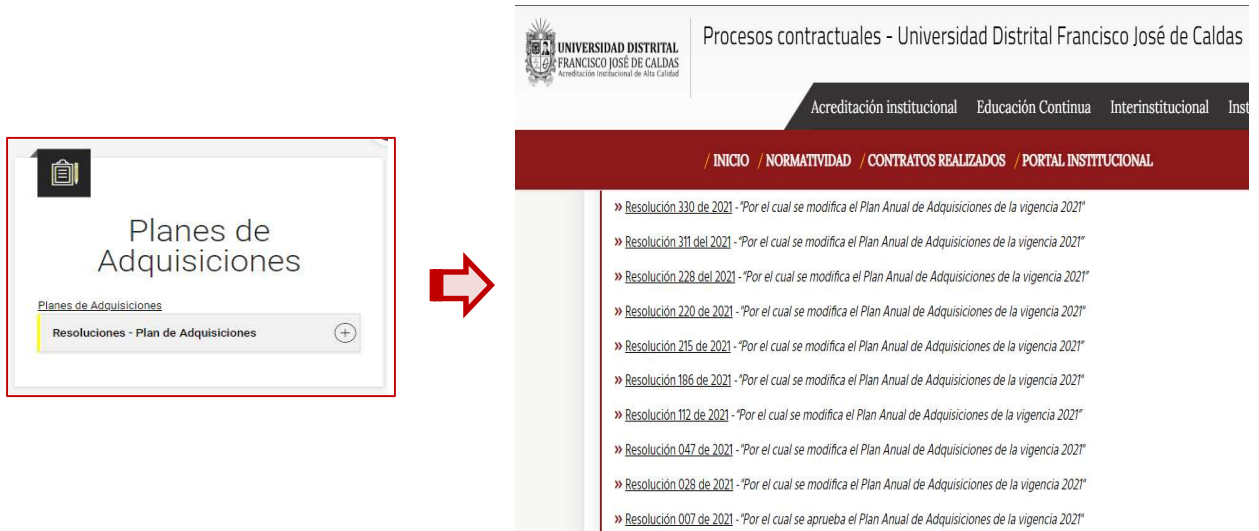
Gráfica 4. Información tomada de la página WEB de la Universidad con corte a 31 de diciembre del 2019.

https://contratacion.udistrital.edu.co/normatividad-contractual/resoluciones-plan-adquisiciones