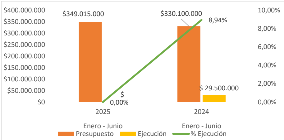
Gráfica No. 2: Capacitación